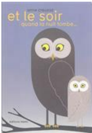
Et le soir quand la nuit tombe / Anne Crausaz. Mémo.