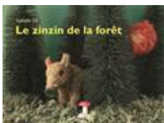
Le Zinzin de la forêt / Isabelle Gil. Ecole des Loisirs (Loulou et compagnie)