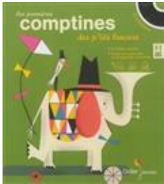
Les premières comptines des p'tits lascars. Didier jeunesse. N° 31. Je fais le tour de ma maison.